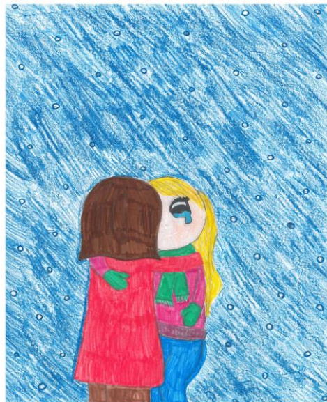
Ada Foss Osmundsvåg 6b