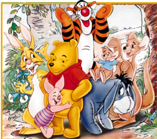
Kanin, gris, bjørn, tiger, esel, kenguru